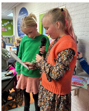
Der wienen ek moaie optredens!

Fan 30 jannewaris oant 7 febrewaris wie Daltonskoalle 't Hazzeleger yn de betsjoning fan Fryske poëzy. Eltse dei waard der oandacht bestege oan Fryske gedichten. Ek it stavers, it hylpers, it hollânsk en it ingelsk kaam foarby. Bern learden oer de rykdom fan de Fryske taal en der wie oandacht yn 'e lessen foar poëzy yn it algemien.